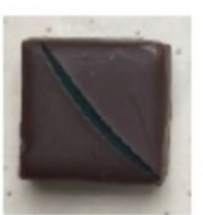
Ganache rhum infusion menthe fraiche Présence d'alcool (rhum)

Allergènes (enrobage lait ou noir) : lait , soja