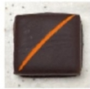
Fruits de la passion

Allergènes (enrobage lait ou noir) : lait , soja