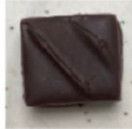
Ganache aux fèves de Tonka du Brésil

Allergènes (enrobage lait ou noir) : lait , soja