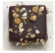
Praliné amandes torréfiées

Allergènes (enrobage lait ou noir) : lait, soja, noisettes, amandes, blé, orge