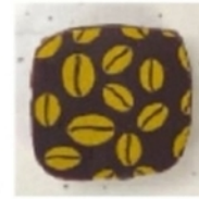
Ganache café Arabica 100%

Allergènes (enrobage lait ou noir) : lait , soja