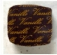
Ganache aux gousses de Vanille de Madagascar

Allergènes (enrobage lait ou noir) : lait , soja