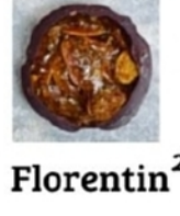
Mendiant 1 & Florentin 2

Allergènes (enrobage lait ou noir) : lait , soja, noisettes 1 , amandes 2