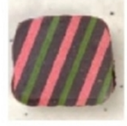
Ganache rhum Présence d'alcool (rhum)

Allergènes (enrobage lait 1-2 ou noir 2 ) : lait 1 , soja 2 , amandes