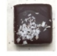
Ganache coco Malibu Présence d'alcool (rhum)

Allergènes (enrobage lait ou noir) : lait , soja